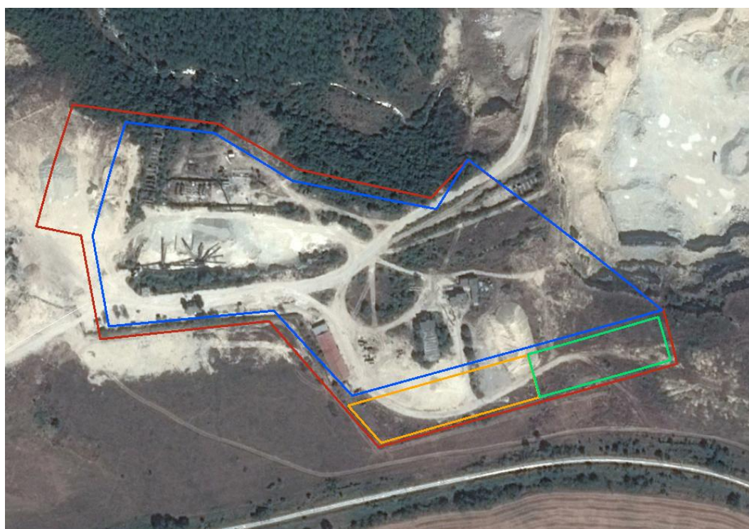
Фигура 1. Сателитна снимка с означено местоположението на находище „Хитрино 4“