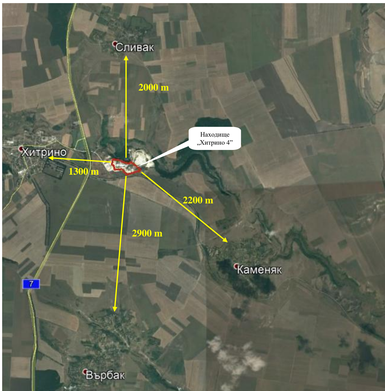
Фигура 4. Сателитна снимка с означено местоположението на ИП спрямо най-близко разположените обекти подлежащи на здравна защита