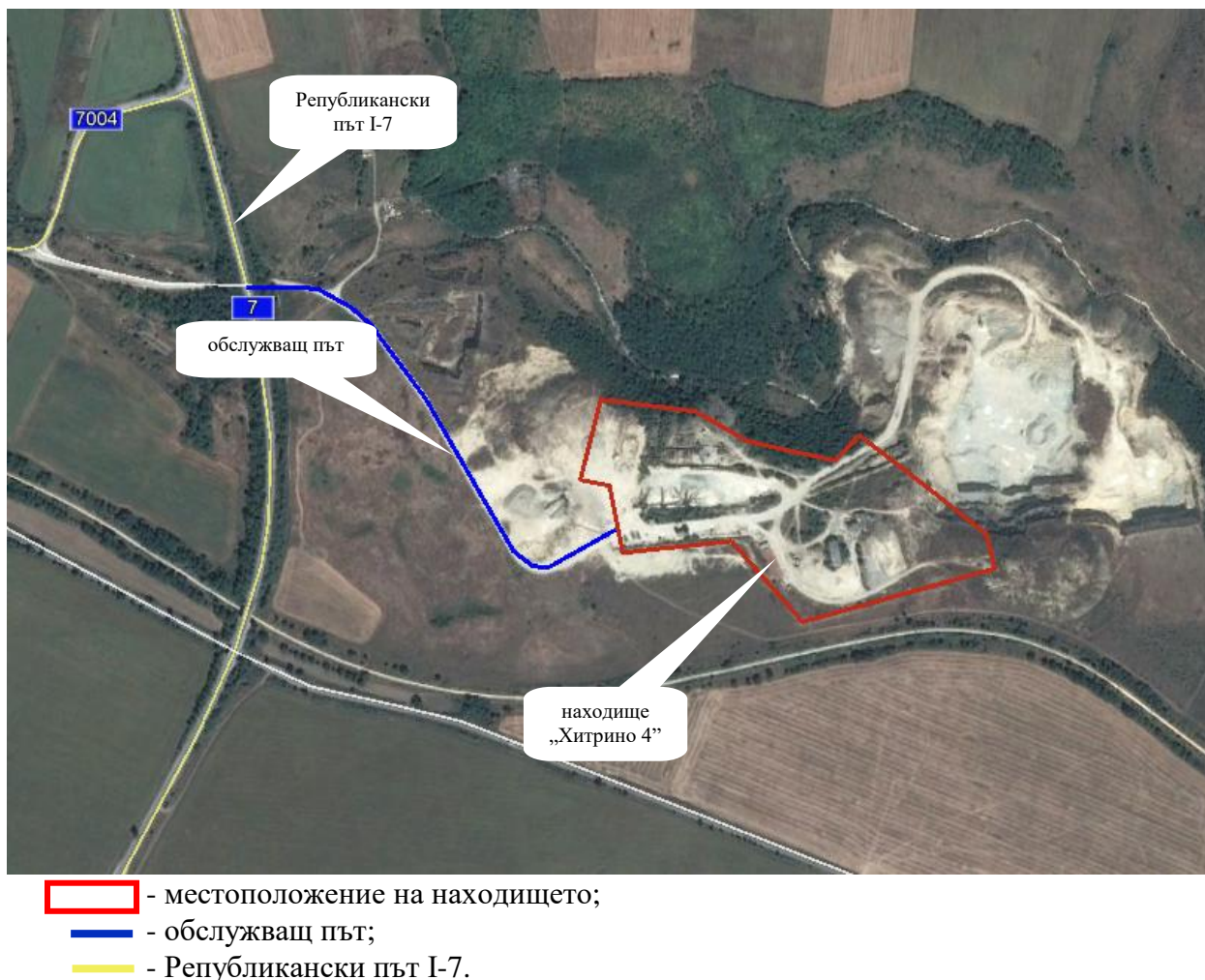
Фигура 3. Сателитна снимка с означено местоположението на находище „Хитрино 4“ и основни пътища в района

Промишлената площадка е свързана с главния път Шумен – Силистра посредством асфалтирано отклонение 600-700m, видно от Фигура 3.